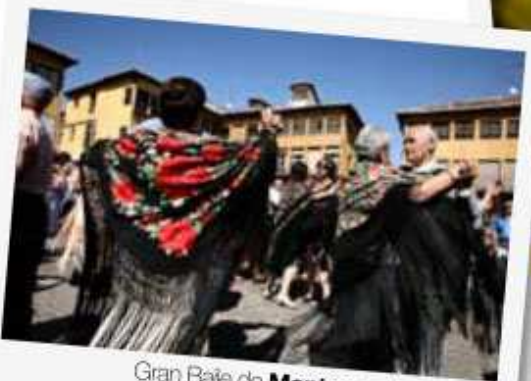
Gran Baile de Mantones de Manila

Los participantes deberán inscribirse en el Ayuntamiento, entre los partícipes se sorteará un mantón de Manila.