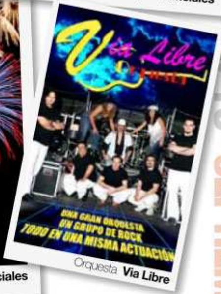
Orquesta Via Libre