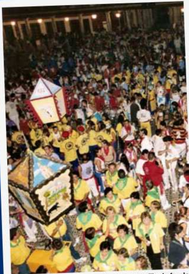
Tradicional desfile de faroles

23:00 El " toque del reloj suelto " y el disparo de Bombas y Cohetes anunciará el comienzo del TRADICIONAL DESFILE DE FAROLES.