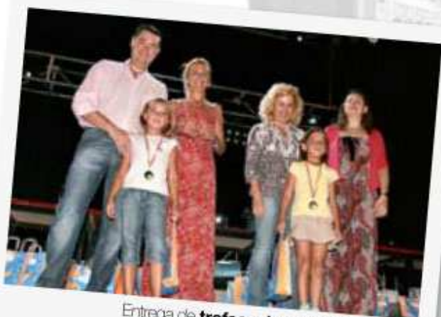
Entrega de trofeos deportes Peña 2010

18:00 PARTIDO DE FÚTBOL Atlético Tordesillas - Real Valladolid juvenil de División de Honor LUGAR Campo de Hierba ENTRADA Libre ORGANIZA Club Atlético Tordesillas