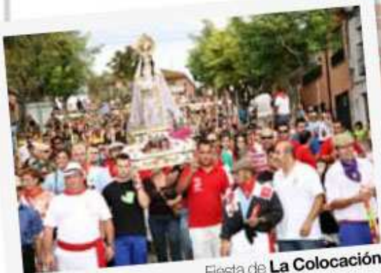
Fiesta de La Colocación

RECORRIDO Plaza Mayor, Santa María, la Parra, Corro Bazán, Cantareros, Postigo, Palacio, Alonso Castillo Solórzano, las Claras, la Soga, Sta. Rita, Santiago, Valverde, San Pedro, y Plaza Mayor.