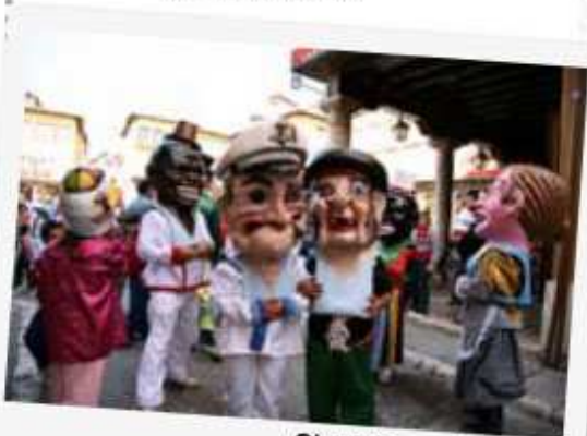
Gigantes y cabezudos

19:00 DESFILE DE FAROLES INFANTILES acompañados de las Charangas "Tropycana", "Sal del Compás" y de "Gigantes y Cabezudos".