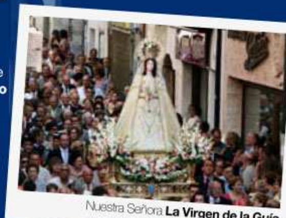
Nuestra Señora La Virgen de la Guía