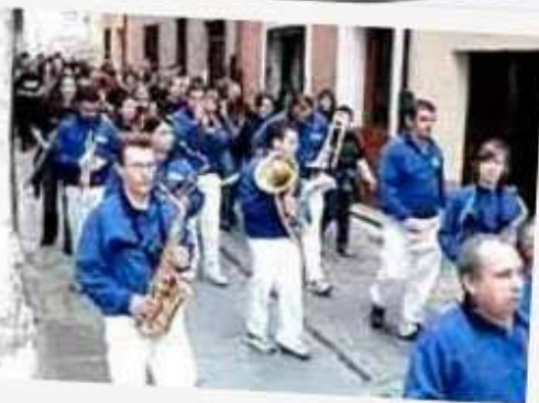
Dianas y pasacalles

19:00 FESTEJO POPULAR. Desenjaule de 4 toros (uno a uno) de cada una de las ganaderías encerradas en días anteriores desde las inmediaciones del puente hasta la plaza de toros.