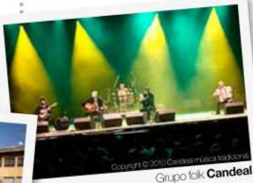
Copyright © 2010 Candeal música tradicional. Grupo folk Candeal

20:00 ACTUACIÓN de música FOLK en la Plaza Mayor con el grupo " CANDEAL "