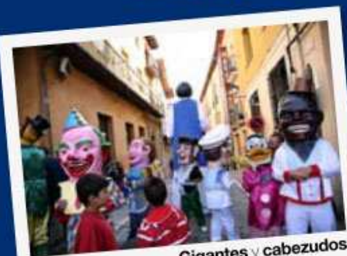
Gigantes y cabezudos

11:30 GIGANTES Y CABEZUDOS que recorrerán las calles de la Villa. DE 11:30 h a 14:00 h y 17:30 h a 19:30 h. PARQUE INFANTIL en el patio del colegio Pedro I