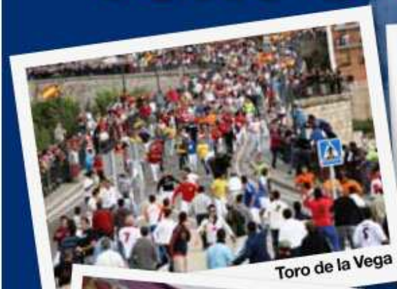
Toro de la Vega