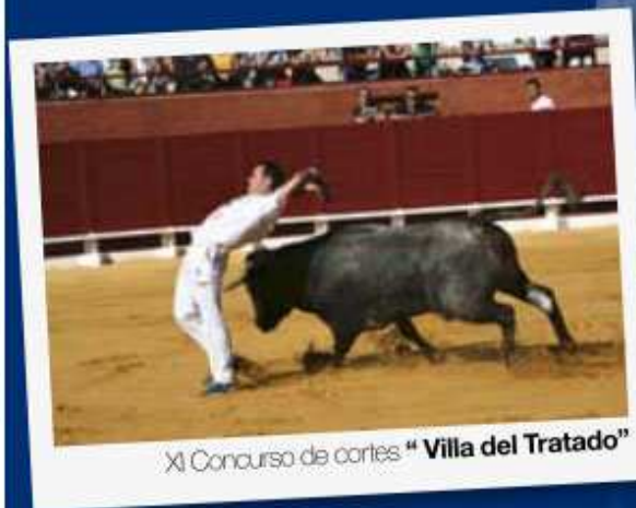
XI Concurso de cortes "Villa del Tratado"

11:00 MISA Solemne y Procesión en honor de Ntra. Sra. la Virgen de la Guía en la Iglesia de Santa María, acompañada con la Banda de Música de Tordesillas. Seguidamente, se pronunciará desde el balcón del Ayuntamiento el pregón de las Fiestas.